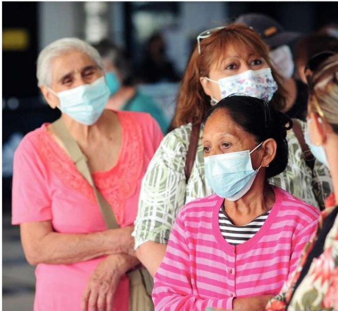
UN MAYOR PORCENTAJE DE MUJERES VIVEN SOLAS EN COMPARACIÓN CON LOS HOMBRES MAYORES.