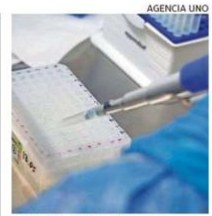
CHILLÁN ENCABEZÓ CASOS.