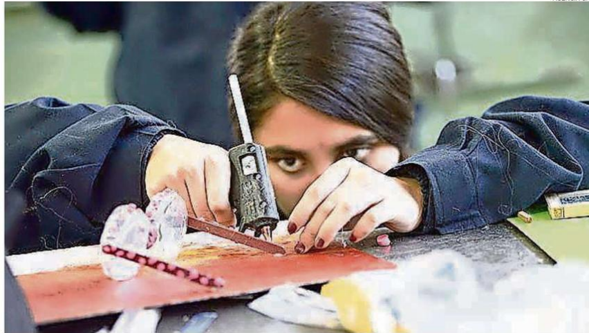
ESTUDIO DE LA UNIVERSIDAD DEL DESARROLLO Y CAJA LOS HÉROOS, ANALIZÓ SITUACIÓN DE LAS JEFAS DE HOGAR EN LA REGIÓN DE ÑUBLE.

Al mismo tiempo, en relación con el sistema previsional, el estudio reveló que solo un 41% está afiliada a algún sistema, mostrando el promedio más bajo en el país. A nivel nacional este indicador llega a un 50%, 20 puntos porcentuales menos en comparación con las mujeres menores de 60 años, y 22,9 puntos menos respecto a los hombres del mis-