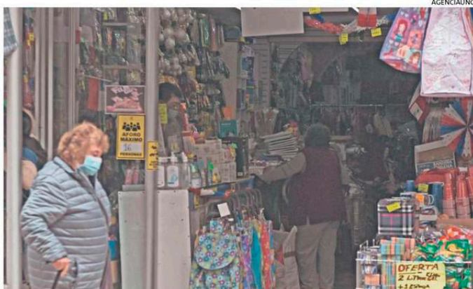
NO ES FÁCIL LA INSERCIÓN LABORAL FORMAL DE LOS ADULTOS MAYORES.

De acuerdo al análisis Ci-PEM, en Chile la informalidad laboral es superior en el caso de las mujeres de 55 años con un 37,8%, en comparación con el 33,9% de hombres del mismo grupo etario. Respecto al tipo de trabajo que desempeñan aque-