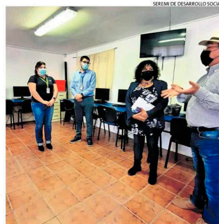
CENTRO DIGITAL FAMILIAR.