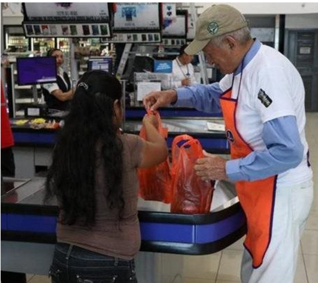
Fotografía: Trabajo de Adulto Mayor