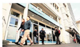
Se abordaron los principales ejes del proyecto que busca modificar el sistema previsional.