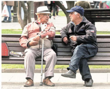
Uno de los desafíos para las economías emergentes es generar las condiciones e incentivos adecuados para que la población de tercera edad logre seguir activa, y no únicamente en una dimensión económica, sino social.

En 2017 la población ocupada de 60 años y más, alcanzó la cifra de 1,16 millones de personas. En los últimos siete años la ocupación relativa en trabajadores de 60 años y más, creció cinco puntos porcentuales pasando de 11% a 16%, mientras que el segmento de edad entre 70 y 74 años disminuyó marginalmente.