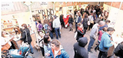
Esta es la quinta edición de este evento, que la última vez reunió a más de 12.000 visitantes.

La Cámara Chileno-Alemana de Comercio e Industria organiza esta única feria de invierno que se realizará del 28 al 30 de junio próximo.