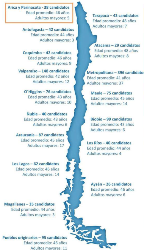
EL ESTUDIO ES UNA RADIOGRAFÍA A LA REPRESENTACIÓN DE LOS ADULTOS MAYORES EN LOS CANDIDATOS CONSTITUYENTES.

A nivel nacional, las regiones que presentan una mayor proporción de candidatos adultos mayores son Atacama (27,6%), Aysén (23,1%) y Los Lagos (22,6%). En tanto, el distrito 14 (compuesto por Alhué, Buin, Calera De Tango, Curacaví, El Monte, Isla de Maipo, María Pinto, Melipilla, Padre Hurtado,