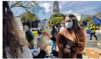
OSORNO ALBERGÓ LA FERIA "YO VIVO TURISMO RURAL LOS LAGOS".

La Semana del Turismo culminará este sábado con la "Expo Feria Provincia de Osorno" en Bahía Mansa, de 12 a 18 horas. La iniciativa reunirá a los siete municipios de