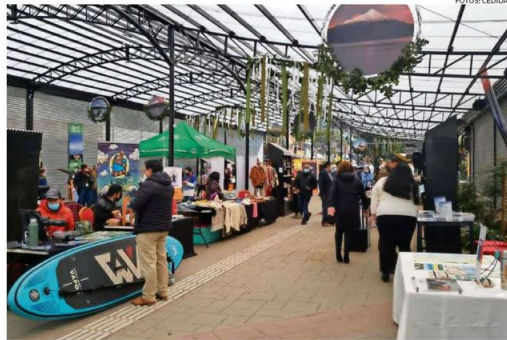
EL LUNES SE REALIZÓ LA "EXPO DESTINO LAGO LLANQUIHUE" EN PUERTO VARAS.

ACTIVIDADES Desde el lunes que se están realizando actividades en dife-