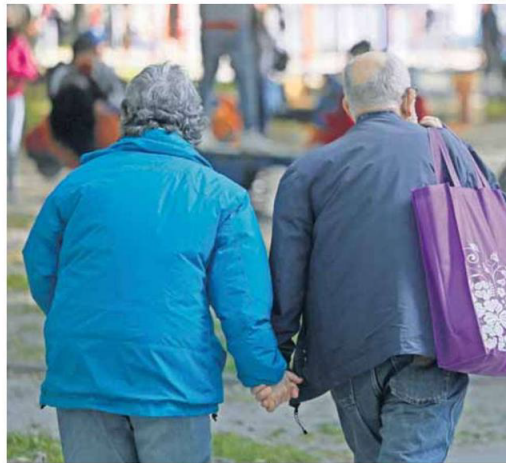
UN 52% DE LOS ADULTOS MAYORES VIVEN EN PAREJA, SEGÚN EL ESTUDIO DE CÍPEP.

En base a las proyecciones del Instituto Nacional de Estadísticas (INE), se estima que actualmente hay casi 90 mil adultos mayores en la región de Antofagasta, representando al 12,3% de la población de la zona, mientras que el 11,1% ya es parte de la cuarta edad (80 años o más). En tanto, el 54,1% son mujeres y el 45,9% hombres.