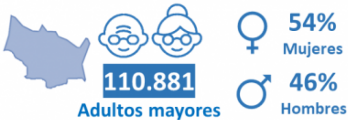
Proporción respecto al total de la población